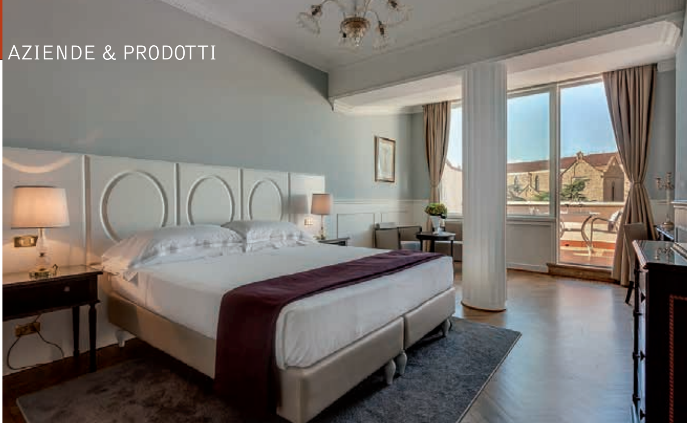
Alcune delle nuove camere dell'albergo fiorentino, classiche, eleganti, luminose

natale di Lawrence, l'Inghilterra. Il Plaza Lucchesi nel secondo dopoguerra del 1900 fu l'albergo preferito degli artisti che si esibivano nel vicino Teatro Verdi. Le loro firme troneggiano nella galleria dei ricordi dell'albergo.