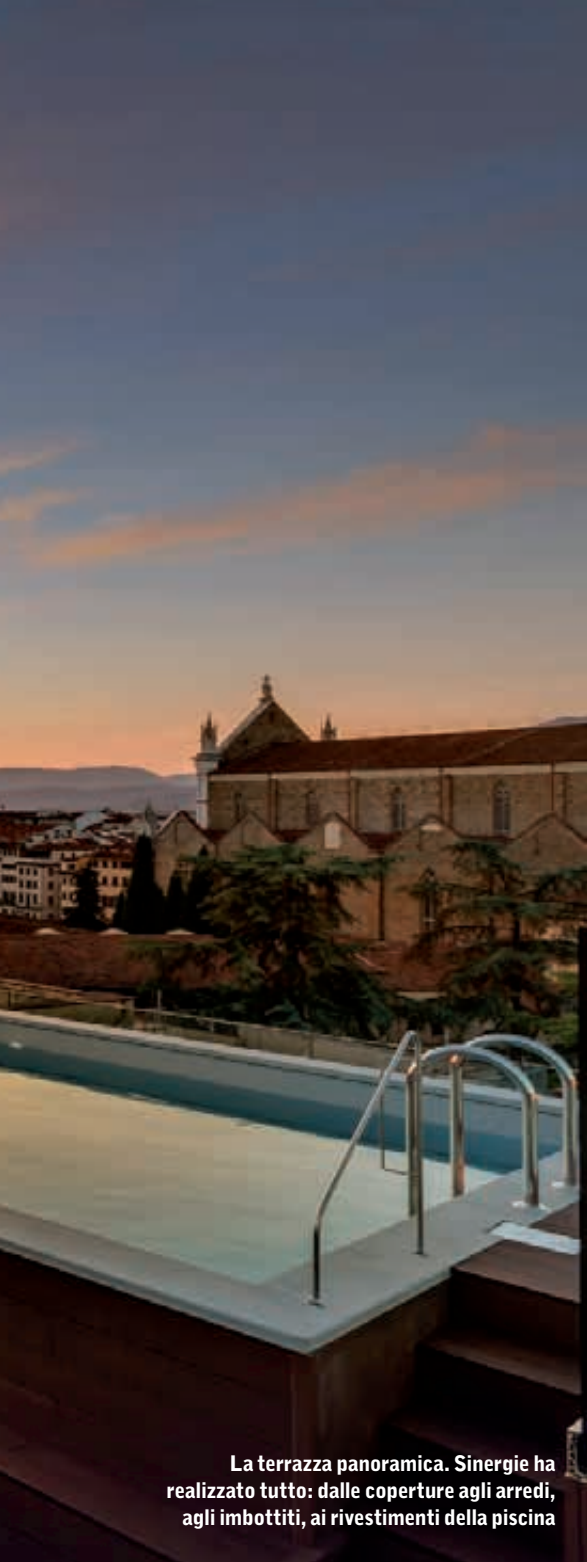
La terrazza panoramica. Sinergie ha realizzato tutto: dalle coperture agli arredi, agli imbottiti, ai rivestimenti della piscina